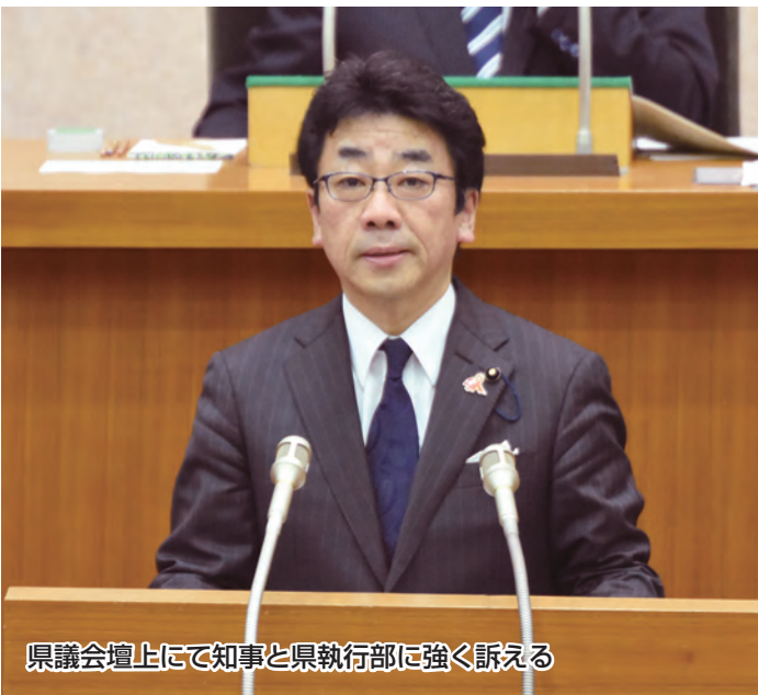
県議会上にて知事と県執行部に強く訴える