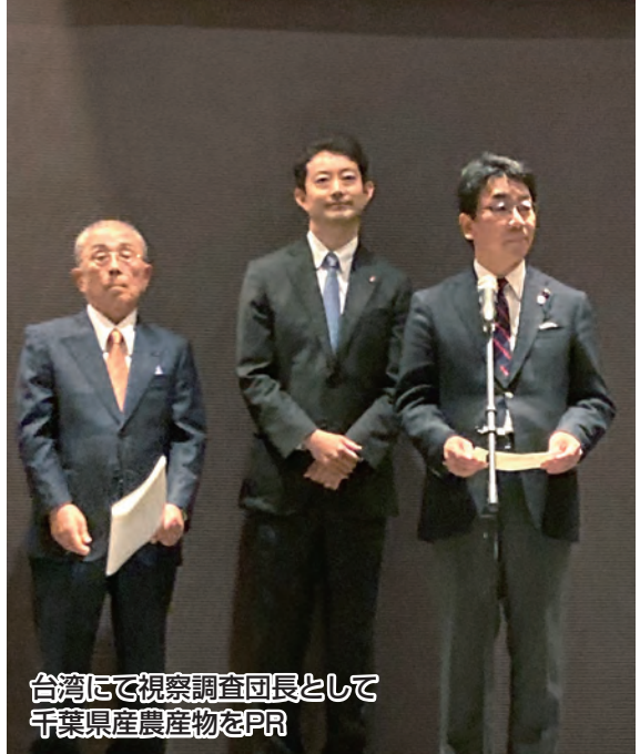
台湾にて視察調査団長として千葉県産農産物をPR