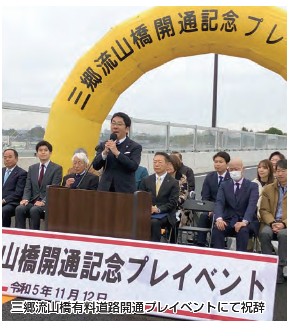
山橋開通記念イベント 令和5年11月12日 三郷流山橋有料道路開通イベントにて祝辞

特別支援学校の流山市内へ新設校または分校の設置について早期に対応を検討するよう強く要望する。