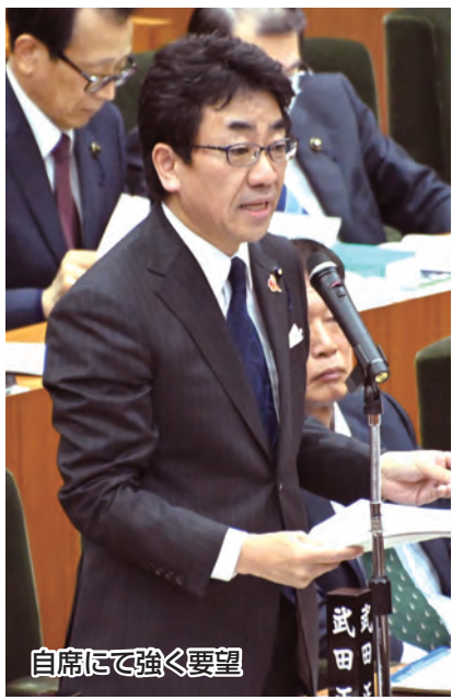
自席にて強く要望

要望 NICUについては東葛北部医療圏だけを見ると国の基準で不足しているも、県全体でカバーしているところとされていることが分かりました。東葛北部地域の将来を担う若手世代が、安心して出産や子育てができる環境づくりのために、県には引き続きの取り組みを要望します。